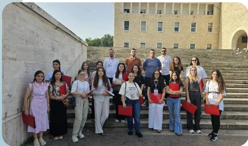
Ekipi i monitoruesve, pranë UPT para nisjes së monitorimit!