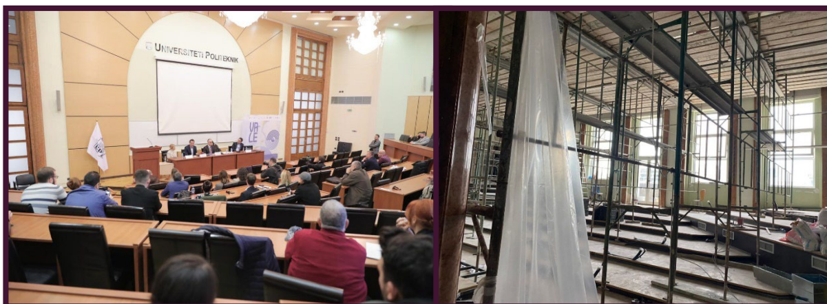
FOTO E SALLËS “SILVANO PEDROLLO” NË UPT, PËRPARA DHE GJATË NDËRHYRJEVE PËR RINOVIMIN I CILI KA KUSHTUAR 221 000 EURO

I vetmi universitet që nuk ka kryer shpenzime në zërin Studime dhe Kërkime është Universiteti i Mjekësisë Tiranë.